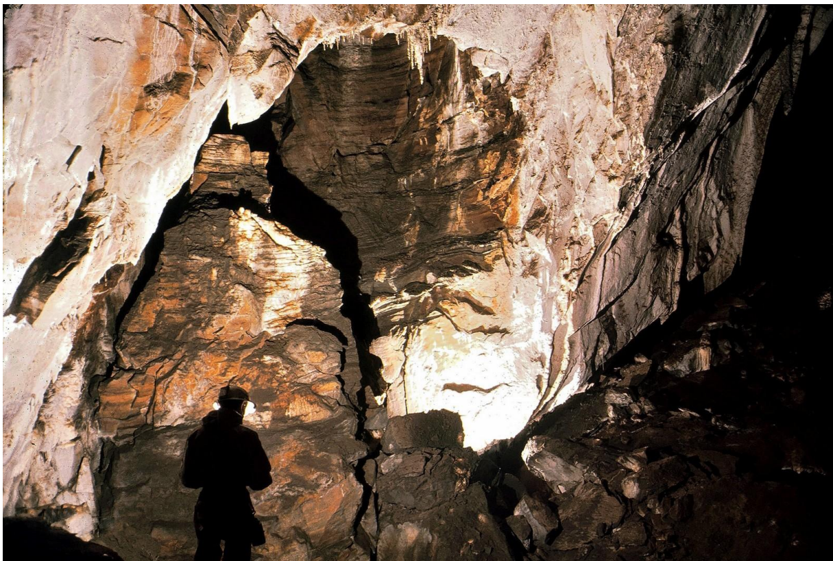
L'entrée de l'Affluent du Porche

Il est possible que nous soyons dans le même cas de figure que le siphon terminal de la Cigalère : voute basse impénétrable et galeries en amont, ces dernières étant celles terminales du gouffre.